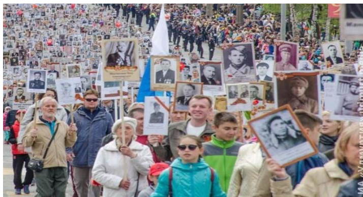
«Бессмертный полк» Саратовская область, город Балаково

5. Сделай фоторепортаж с празднования 75-летия Победы в Великой Отечественной войне в твоём городе (поселке, селе).